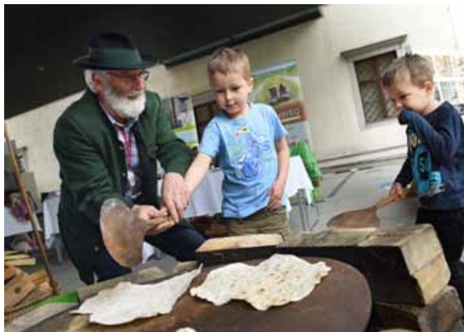
Zelten backen beim Freilichtmuseum Furthmühle, Pram