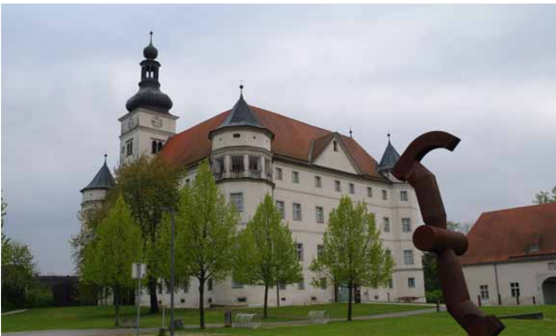
Der Lern- und Gedenkort Schloss Hartheim