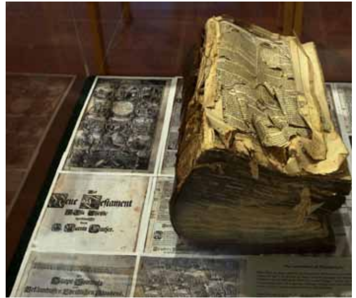
Fragment einer Weimarer Bibel 1703, Verlag...Endter, Nürnberg