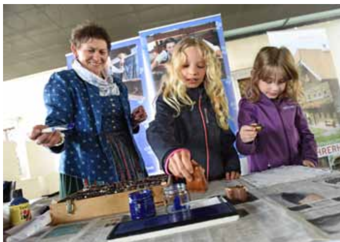
Stempeln mit Blaudruckmodellen beim Stand des Färbermuseums