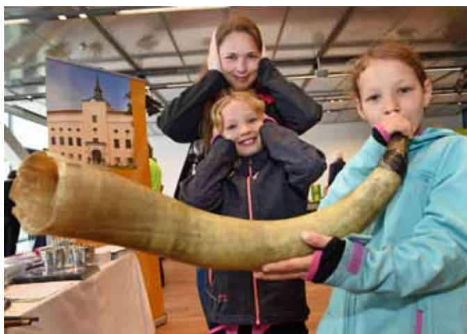
Instrumente ausprobieren beim Stand des Musikinstrumentenmuseums Schloss Kremsegg