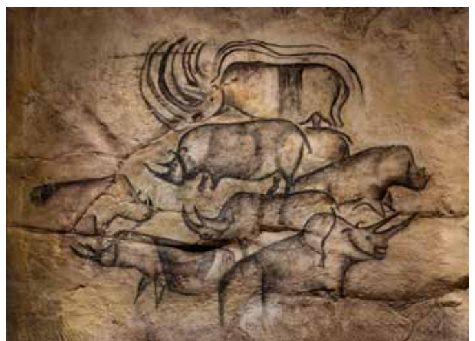
Detail aus der Höhle von Chauvet (Nachbildung)