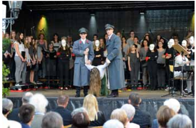
Theateraufführung im Rahmen der Eröffnungsfeier