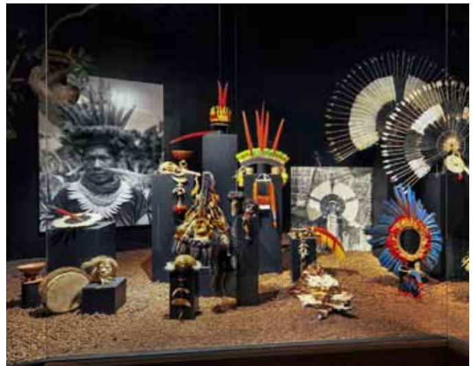
Federschmuck aus Südamerika