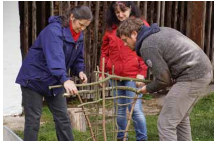
Lehrer erlernten das Handwerk des Weidenbaus im Rahmen eines Fortbildungsseminars

Freilichtmuseum Denkmalhof Unterkagerer Auberg 19 | 4171 Auberg Tel.: +43 (0) 664/4641941 E-Mail: unterkagererhof.koordinatorin@gmail.com Web: www.unterkagererhof.at Öffnungszeiten: Nach telefonischer Vereinbarung