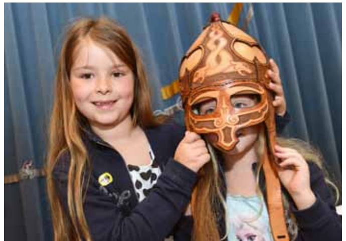
Den Nachbau einer Waräger Rüstung aus dem 10. Jahrhundert bestaunen und sogar probieren konnte man beim Stand des Österreichischen Sattlermuseums.

Einen Kurz-Workshop zum Herstellen eines Lederarmbandes mit individueller Prägung bot das Österreichische Sattlermuseum, das auch mit dem Nachbau einer Waräger Rüstung aus dem 10. Jahrhundert die Bewunderung der Besucher erntete. Im Kurrentschreiben mit Tinte und Feder konnte man sich beim OÖ. Literaturmuseum des Stifterhauses üben oder mit Griffel und Tafel beim OÖ. Schulmuseum. Beeindruckt hat auch