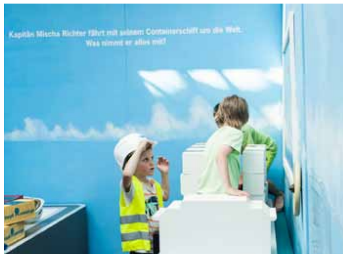
Die Welt passt in ein Schiff — Junge Besucher verladen gemeinsam Container auf das Schiff nach Shanghai