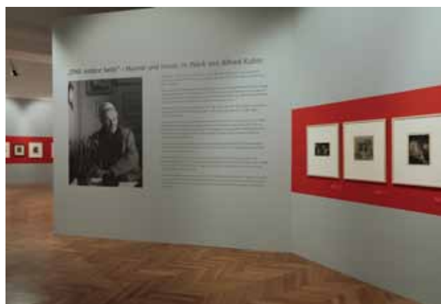
Blick in die Ausstellung: Eine andere Seite – Humor und Ironie im Werk von Alfred Kubin