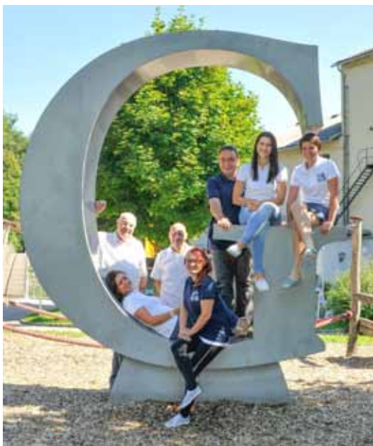
Das Team des Österreichischen Papiermachermuseums

Österreichisches Papiermachermuseum Museumsplatz 1 | 4662 Steyermühl Tel.: +43 (0) 7613/3951 E-Mail: papier.druck@papierwelten.co.at Web: www.papiermuseum.at Öffnungszeiten: 1. April bis 31. Oktober Dienstag bis Sonntag 10:00 bis 16:00 Uhr und ganzjährig nach Voranmeldung