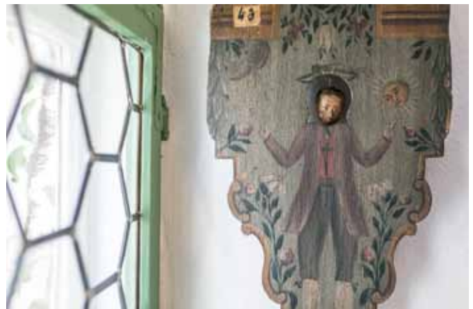
Wettermandl im Heimatmuseum Braunau, Objekt des Monats April