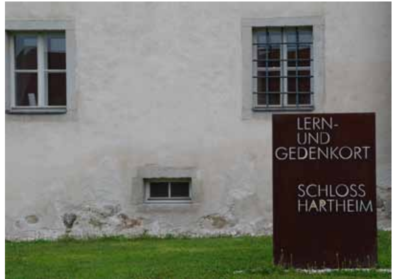
Der Lern- und Gedenkort Schloss Hartheim