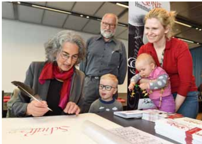
Schriftkünstlern über die Schulter blicken – Schrift- und Heimatmuseum Barthaus