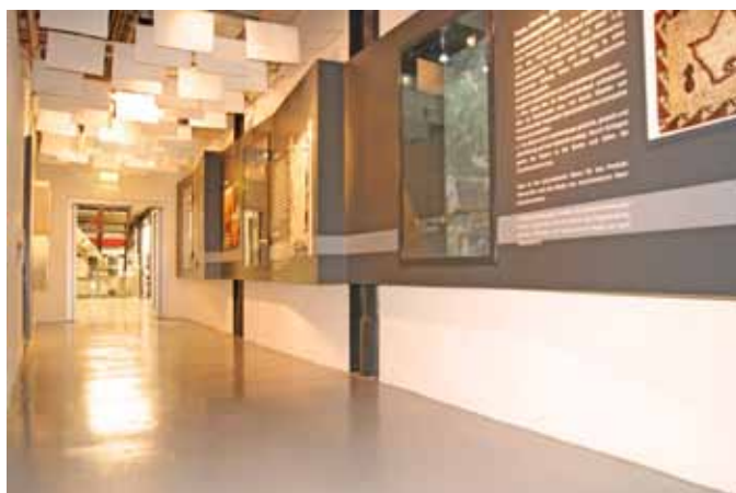
Im Zuge der Landesausstellung 2008 im Salzkammergut wurde der gesamte Museumsbereich des Papiermachermuseums neu gestaltet