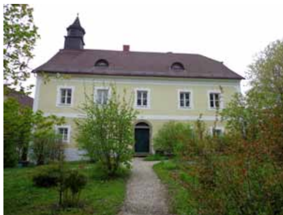
Das Kubin-Haus in Zwickledt