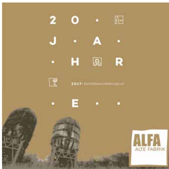
2017 feiert das Papiermachermuseum sein 20-jähriges Bestandsjubiläum

Die nächsten wichtigen Meilensteine waren die Eröffnung des Feuerwehrmuseums im Jahr 1999, des Druckereimuseums im Jahr 2000 und die Eröffnung des völlig neu adaptierten Veranstaltungszentrums im Jahr 2003 sowie die Teilnahme an der Landesausstellung 2008 im Salzkammergut, bei welcher der gesamte Museumsbereich des Papiermachermuseums völlig neu gestaltet wurde. Weiters konnte im Rahmen der Landesausstellung eine neue Fußgänger- und Radfahrerbrücke über die Traun errichtet und somit das Schaukraftwerk Gschröff für Besucher in den Museumskomplex integriert werden. Die integrative Malschule, eine Lithografiewerkstatt und die Galerie für Papierkunst im