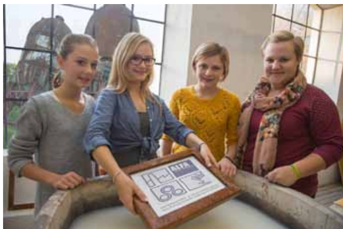
Vielfältiges Workshopangebot für Besucherinnen und Besucher aller Altersgruppen