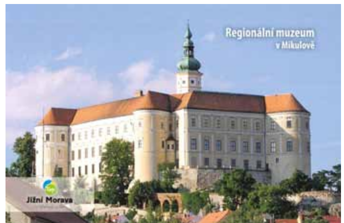
Ansichtskarte Regionalmuseum Mikulov/Nikolsburg

In Oberösterreich erhält „Archäologie im Museum“ aber trotzdem zusätzliche Gewichtung, da mit den prähistorischen Pfahlbauten an Attersee und Mondsee seit einigen Jahren ein UNESCO Welterbe installiert ist und mit dem römischen Donaulimes sich ein weiteres in der Phase der Antragstellung befindet. Hinzu kommt