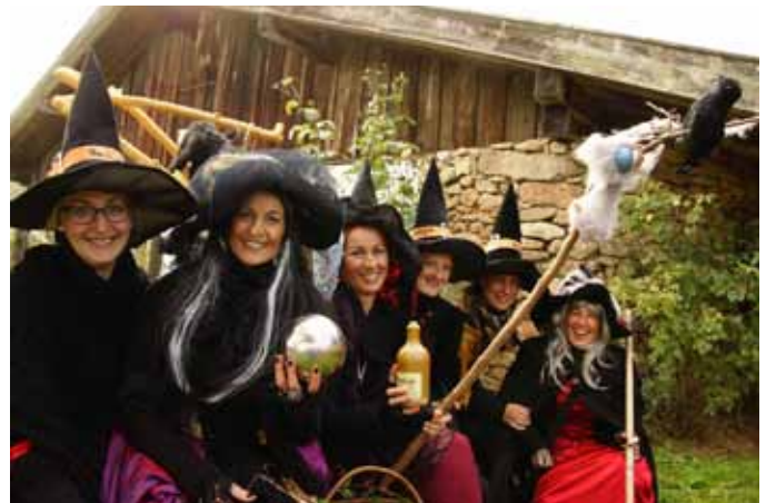
Der Hexenrat erfreute sich am bunten Treiben am Unterkagererhof von der wandernden Sunnberg aus.