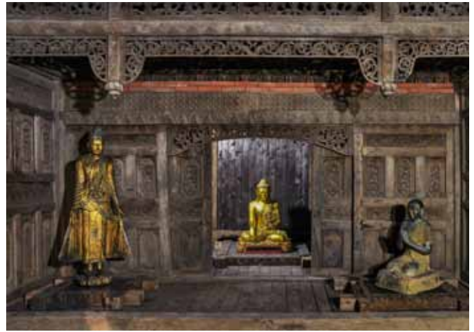
Tempel von Java

Evolutionmuseum Schmiding Gemeinsamer Eingang mit dem Zoo Schmiding Schmidinger Straße 5 | 4631 Krenglbach Tel.: +43 (0) 7249/46272-15 E-Mail: office@evolutionmuseum.at Web: www.evolutionmuseum.at Öffnungszeiten: täglich 9:00 bis 18:00 Uhr letzter Einlass 17:00 Uhr