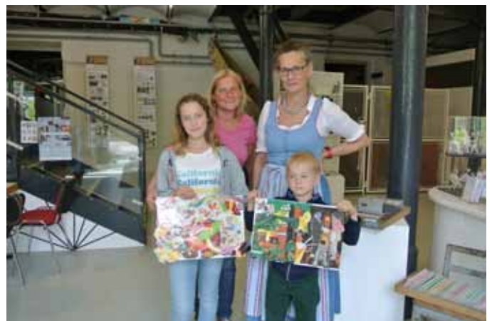
Eigene Collagen konnten im Österreichischen Papiermachermuseum angefertigt werden