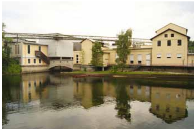
Das Wasser der Traun als zentrales Element für die Papierherstellung