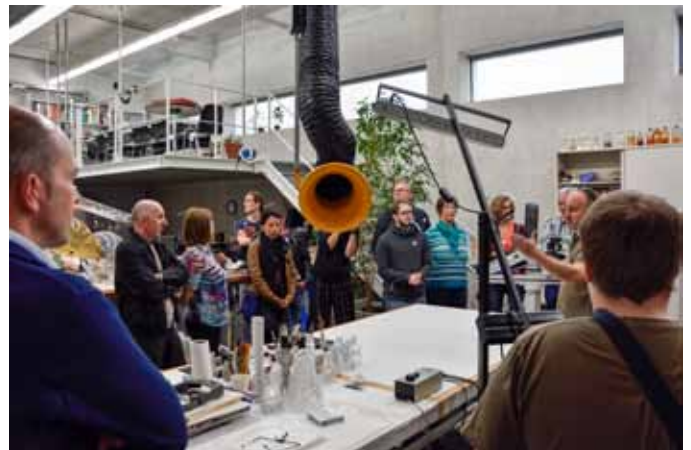
Führung in der Restaurierwerkstatt im LENTOS Kunstmuseum Linz