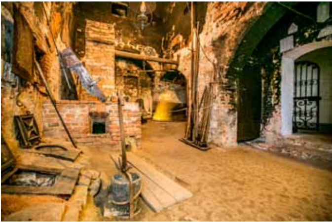
Die einzigartige Glockengießerei im Heimathaus Braunau