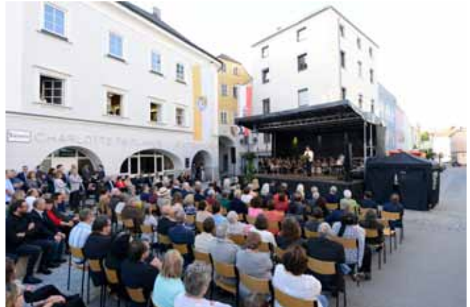
Eröffnung des Lern- und Gedenkorts Charlotte-Taitl-Haus in Ried im Innkreis