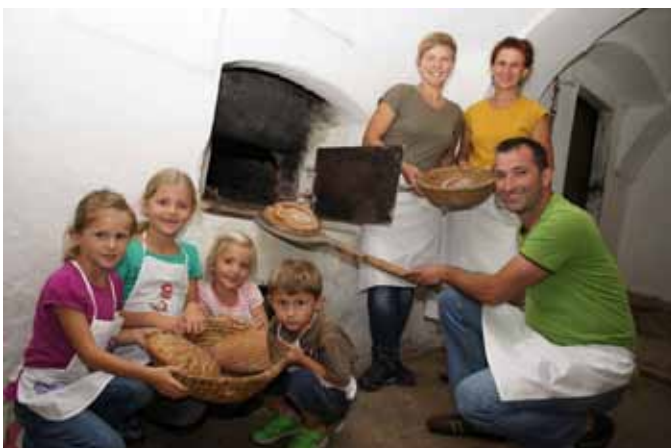
Brotbackkurs am Denkmalhof Unterkagerer im Herbst im Alten Backofen