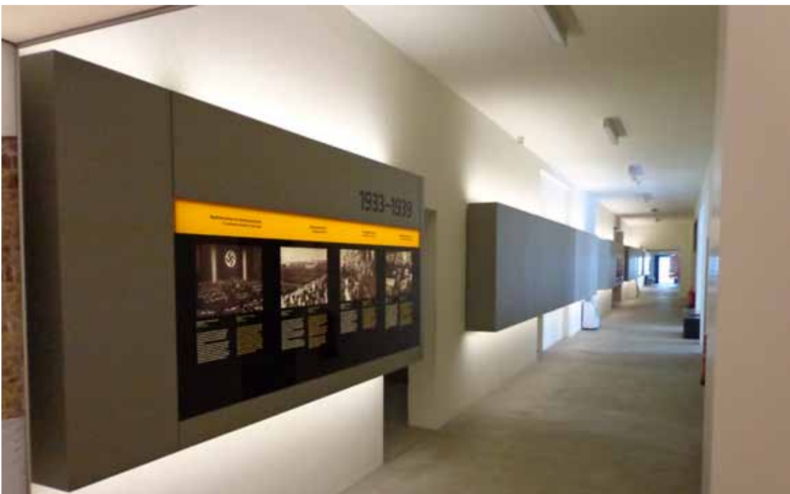
Blick in den Ausstellungsbereich der KZ-Gedenkstätte Mauthausen