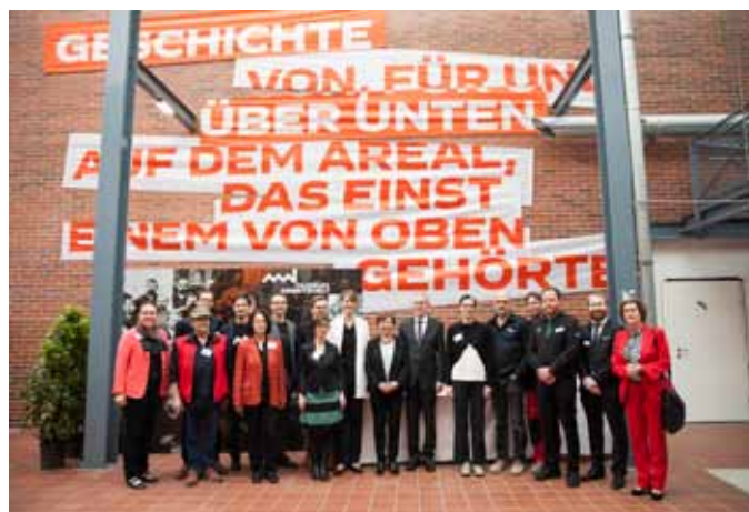
Team des Museums mit Bundespräsident Van der Bellen und seiner Gattin Doris Schmidauer