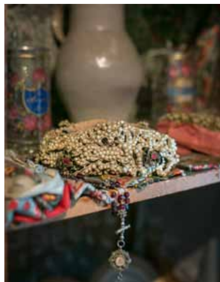
Objekt des Monats Mai: Brautkrone, 19. Jahrhundert