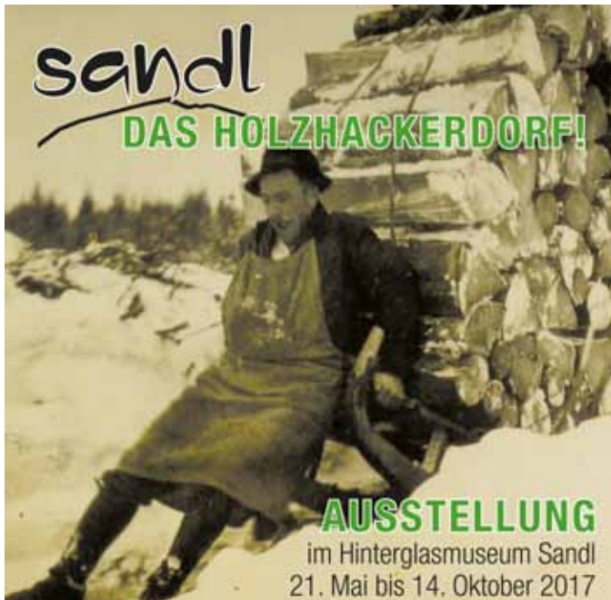
Plakat zur Ausstellung