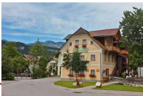
Heimat- und Landlermuseum Bad Goisern