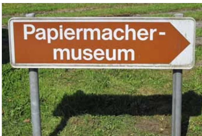
Hier gehts zum Papiermachermuseum ...