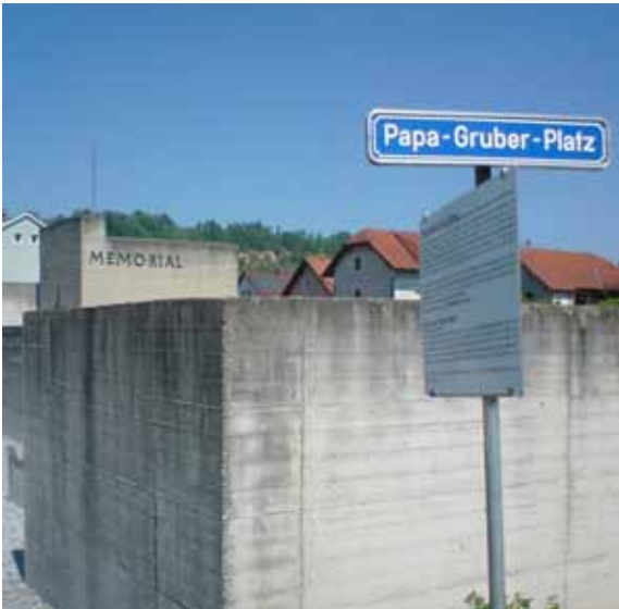
Das Memorial Gusen