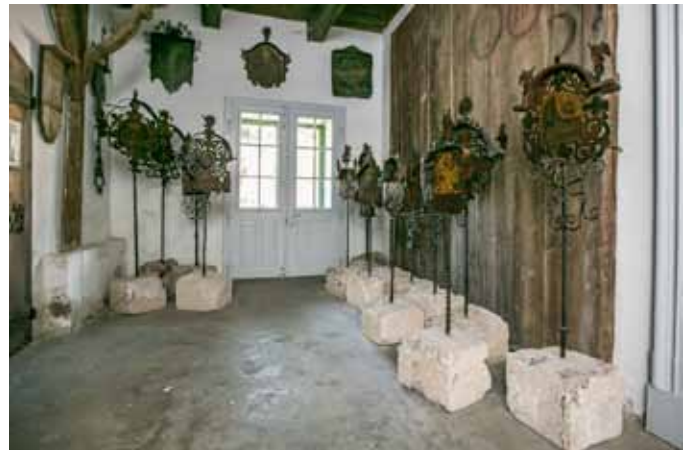
Schmiedeeiserne Grabkreuze im Heimatmuseum Braunau