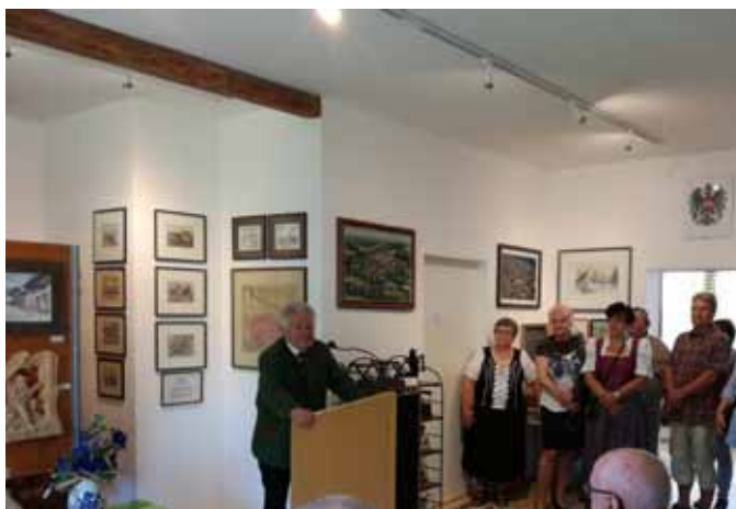
Alt-Landeshauptmann Dr. Josef Pühringer bei der Wiedereröffnung des Heimatmuseums Wallern