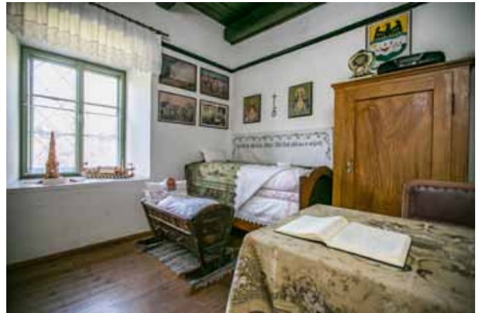
Heimathaus Braunau – Ausstellungsansicht

sprechend verdreht. Als Objekt des Monats im Mai wurde eine Brautkrone aus dem 19. Jahrhundert ausserkoren, die der Braut am Hochzeitstag als Zeichen der Jungfräulichkeit aufgesetzt wurde.