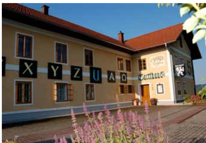
Schrift- und Heimatmuseum Bartlhaus