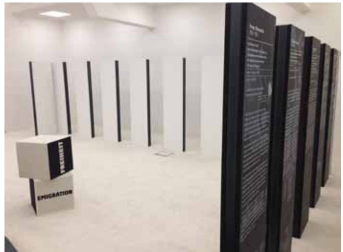
Biografie-Stelen im Lern- und Gedenkort Charlotte-Taitl-Haus

Bereits bei der Benennungsfeier wurde angekündigt, dass die Stadtgemeinde Ried in diesem Haus einen Lern- und Gedenkort errichten werde, der den Opfern von Nationalsozialismus und Faschismus im Bezirk Ried im Innkreis gewidmet ist. Die Initiative für dieses Projekt war von der ARGE Lern- und Gedenkort ausgegangen. Die Grundlage bildete die Publikation Nationalsozialismus im Bezirk Ried im Innkreis. Widerstand und Verfolgung 1938–1945 von Gottfried Gansinger, ergänzt durch Forschungen von ARGE-Mitgliedern. Charlotte Taitl steht stellvertretend für die 196 bisher bekannten Opfer von Nationalsozialismus und Faschismus im Bezirk Ried. Den Opfern ihre Namen zurückzugeben und sie so der Vergessenheit zu entreißen war das Ziel.