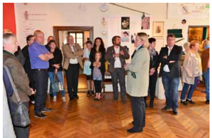
Ausstellungseröffnung „200 Jahre Stadtkapelle Grein“