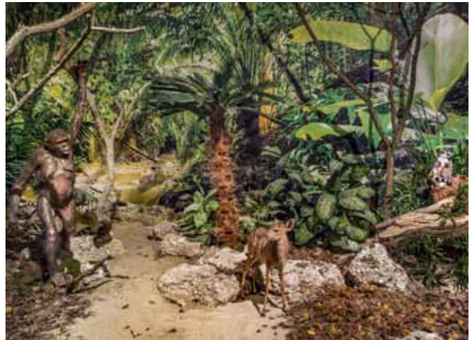
Urwald Ardipithecus ramidus

Das Museum zeigt den langen Weg der Menschwerdung. Sie sehen Neandertaler auf der Jagd oder die eindrucksvollen Wandmalereien, die vor 28.000 bis 18.000 Jahren in der Höhle von Chauvet entstanden sind. Weiter geht es mit dem altägyptischen Grab des Sennedjem, das Aufschluss über Rituale der Mumifizierung und den ägyptischen Glauben bietet. Weiter entdecken die Besucherinnen und Besucher einige indigene Völker, in denen der erbeutete Kopf mit dem Gehirn eines Gegners als Quelle der Macht und wichtigstes Zeichen eines erfolgreichen Kriegers galt. Die zahlreichen Objekte aus der Benin-Zeit mit den Bronze-Köpfen von Königen und Königinnen, welche zur Verehrung auf den Altären aufgestellt wurden, leiten zu den Reliquiarobjekten der Fang und Kota über. Auch die rund 2000 Jahre alten