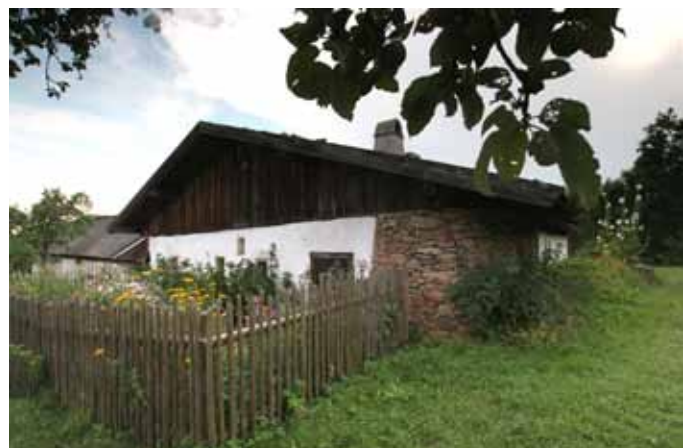
Denkmalhof Unterkagerer Auberg