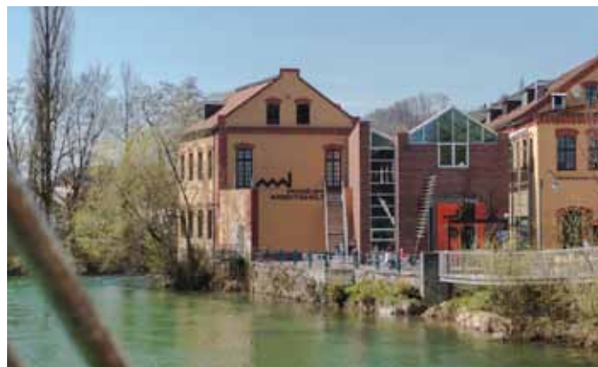
Museum Arbeitswelt Steyr