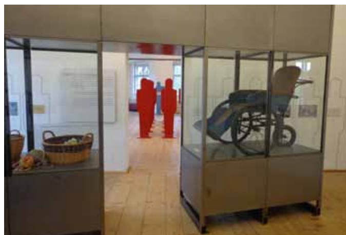
Ausstellungsansicht „Wert des Lebens“ im Lern- und Gedenkort Schloss Hartheim

Lern- und Gedenkort Schloss Hartheim Schlossstraße 1 | 4072 Alkoven Tel.: +43 (0) 7274/65 36-546 E-Mail: office@schloss-hartheim.at Web: www.schloss-hartheim.at Öffnungszeiten: