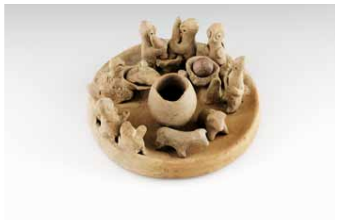
Syro-hethitische Bäckerei (Modell), Palästina um 3000 v. Chr., Ton