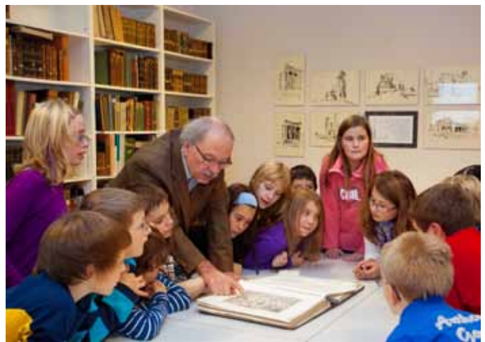
Medien- und Bibliotheksraum im neu gestalteten Heimathaus-Stadtmuseum Perg