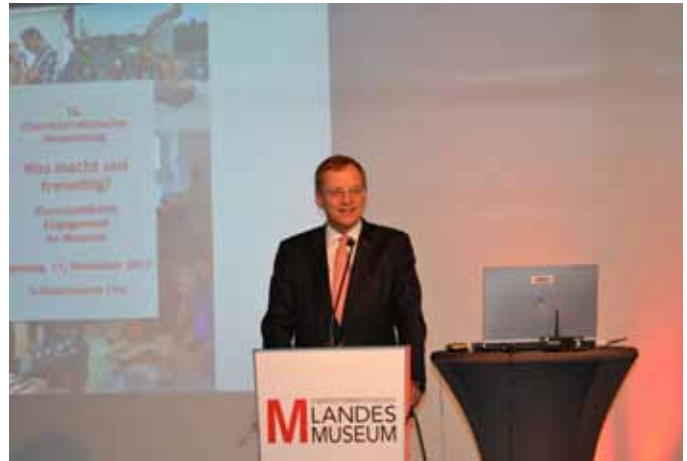
Landeshauptmann Mag. Thomas Stelzer eröffnete den 16. Oberösterreichischen Museumstag