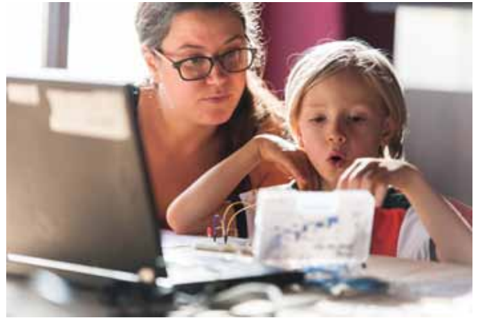
Arduinos können auch schon von den Kleinsten programmiert werden.