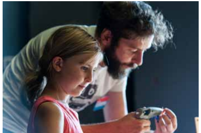
Hier wurden gerade Zahnbürsten-Roboter gebastelt.