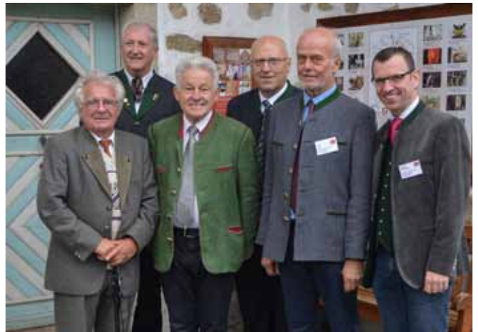
Gruppenfoto der Museumsverantwortlichen mit Landeshauptmann a. D. Dr. Josef Pühringer.