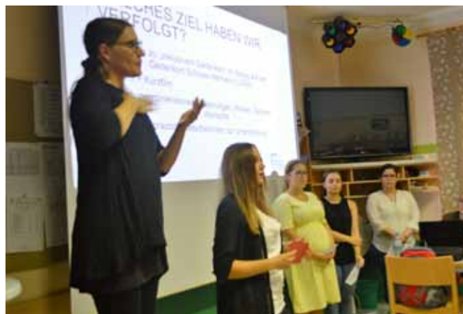
Präsentation im Linzer Gehörlosen Kultur- und Sportverein