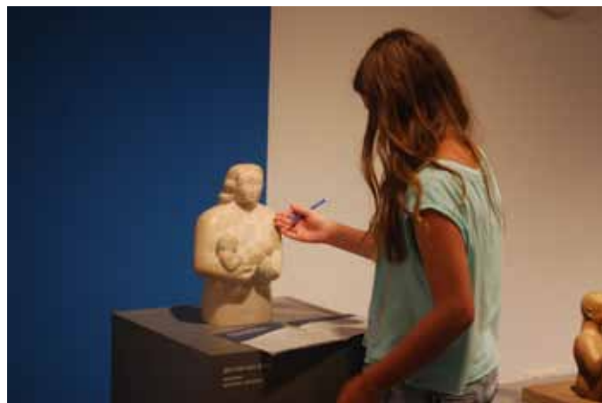
Kunst erleben, spüren, berühren

DARINGER Kunstmuseum Aspach Marktplatz 8 | 5252 Aspach Tel.: +43 (0) 7755/73 55 (Marktgemeindeamt) E-Mail: kunstmuseum@daringer.at Web: www.daringer.at Öffnungszeiten: Freitag, Samstag und Sonntag 14:00 bis 17:00 Uhr Führung für Individualbesucher: Samstag 14:00 Uhr Führungen für Gruppen nach Voranmeldung unter +43 (0) 676/36 38 260 möglich