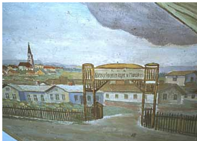
Kriegsgefangenenlager Marchtrenk

Darüber hinaus jährt sich aber 2018 auch der Todestag Adalbert Stifters zum 150. Mal. Besonders im StifterHaus, das nächstes Jahr auch seinen 25. Geburtstag feiert, wird es ein umfangreiches Ausstellungs- und Veranstaltungsangebot rund um das Leben und Werk Adalbert Stifters geben. Hier ist unter anderem im Kontext zum Ende des Ersten Weltkrieges aber auch die Ausstellung Karl Kraus und Oberösterreich geplant, in der unter anderem Material aus dem Nachlass von Karl Kraus gezeigt werden soll. Karl Kraus hielt sich wiederholt in Bad Ischl auf, seine Vortragstätigkeit führte ihn aber auch nach Linz. In der von ihm herausgegebenen satirischen Zeitschrift Die Fackel findet sich beispielsweise auch der Abdruck eines Stifter-Briefes.