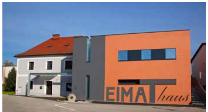
Das erweiterte Heimathaus-Stadtmuseum Perg, 2010