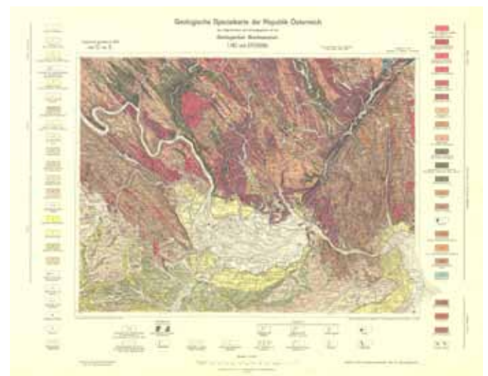
Geologische Spezialkarte, Blatt Linz-Eferding 1:75.000 (Hrsg.: Geologische Bundesanstalt)