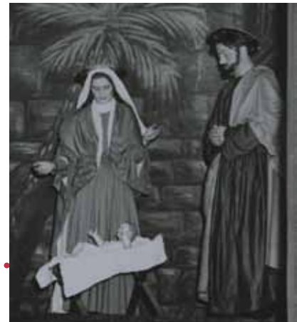
Szenenfoto Ischler Krippenspiel 1954/1955. Archiv des OÖ. Landesmuseums – Sammlung Volkskunde und Alltagskultur (Foto: OÖ. Landesmuseum, A. Bruckböck)