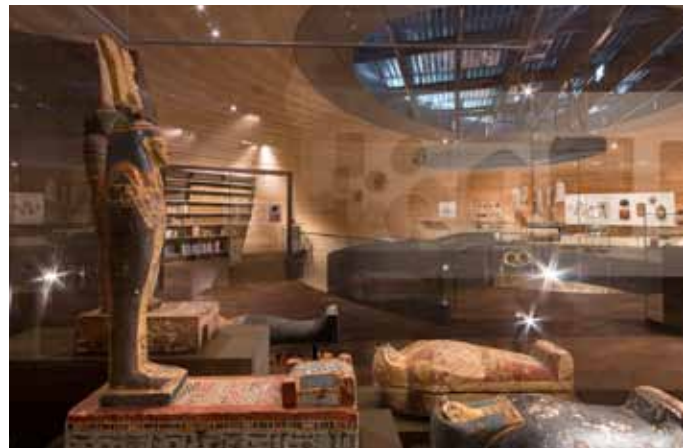
Ausstellungsarchitektur und Blick in die Ausstellung