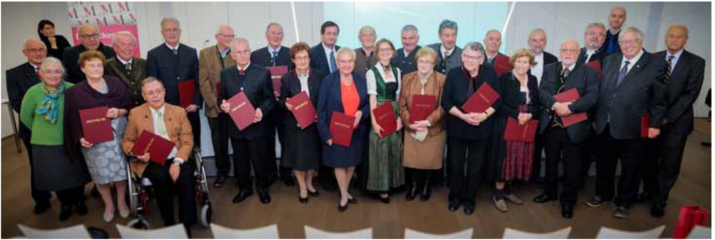
Die geehrten ehrenamtlichen Festgäste nach der Überreichung der Urkunden

sorgte das Ensemble Zweirath mit einer Auswahl feiner Musikstücke. Und da zu einer gelungenen Feier auch gutes Essen gehört, lud die Oberösterreichische Versicherung AG im Anschluss zu einem geselligen Ausklang mit einem vorzüglichen Buffet ein.