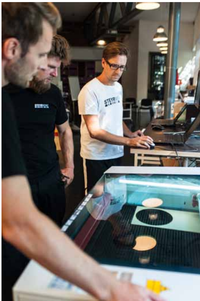
Fast immer im Einsatz: der Laser Cutter im Makerspace der Steyr-Werke