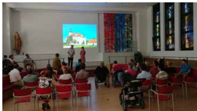
Präsentation der Studie im Institut Hartheim

Die Gebärdensprachdolmetscherinnen machten Lehre und Forschung barrierefrei möglich. Der Forschungsprozess war durch die Einbeziehung von Menschen mit Behinderungen in allen Schritten partizipatorisch angelegt und hatte auch emanzipatorischen Charakter. Die Forschung sollte die befragten Menschen stärken, ihre Ansichten und Wünsche zu artikulieren und weiterzutragen. Gerade im Ausstellungs- und Museumsbereich werden Menschen mit Behinderungen noch immer nicht ausreichend als Zielgruppe in ihrer gesamten Heterogenität gesehen, die auch – über eine bauliche Barrierefreiheit hinaus – eigene Vorstellungen und Anforderungen vorbringen kann und will.