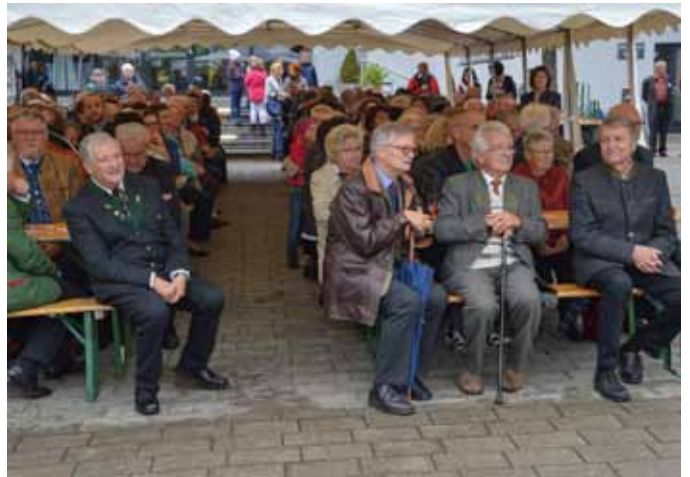
Zahlreiche Festgäste aus nah und fern konnten bei der Feier begrüßt werden.