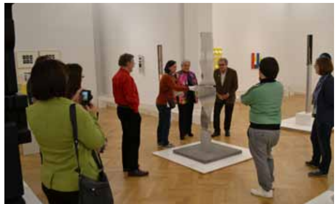
Führung durch die Sonderausstellung „Spielraum. Kunst, die sich verändern lässt“ in der Landesgalerie Linz