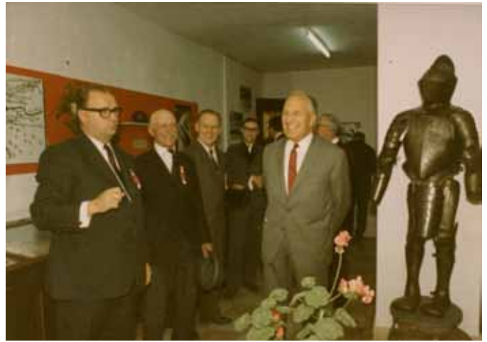
Eröffnung der stadtgeschichtlichen Ausstellung, 1969

Heimathaus Stadtmuseum Perg Stifterstraße 1 | 4320 Perg Tel.: +43 (0) 7262/53 535 E-Mail: heimathaus-stadtmuseum@perg.at Web: www.pergmuseum.at Öffnungszeiten: Samstag und Sonntag 14:00 bis 17:00 Uhr und nach Voranmeldung