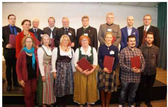
Gruppenbild der Absolventinnen und Absolventen des Lehrgangs „Museumskustode/-in“