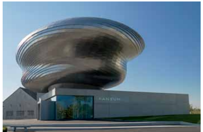
PANEUM. Außenansicht des Museums

Das quaderförmige Sockelgebäude bildet das Fundament des PANEUM und beinhaltet das Kundeninformati-