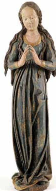
Madonna, Oberösterreich, um 1500, Lindenholz