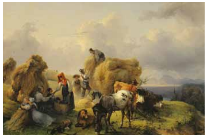
Ernteszene, Friedrich Gauermann, Alpenvorland, 1835, Öl auf Leinwand