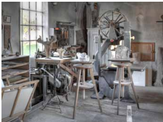
Die im Originalzustand erhaltene Bildhauerwerkstätte Manfred Daringers

Eine essentielle Rolle bei der Auszeichnung des DARINGER Kunstmuseums Aspach mit dem Österreichischen Museumsgütesiegel nahmen unter anderem die regio-