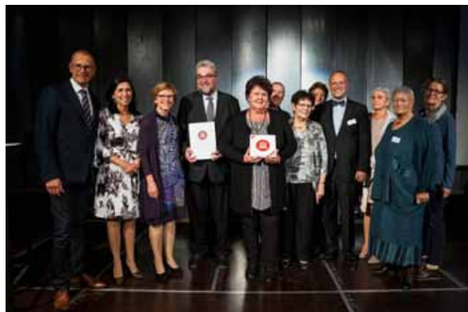
Verleihung Museumsgütesiegel in Steyr

ARGE Kunst und Kultur – Mitten im Innviertel Website: www.innviertelkultur.at E-Mail: info@innviertelkultur.at