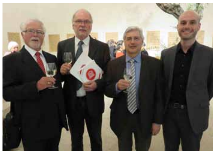
Bei der Verleihung des Österreichischen Museumsgütesiegels in Bregenz, 2014