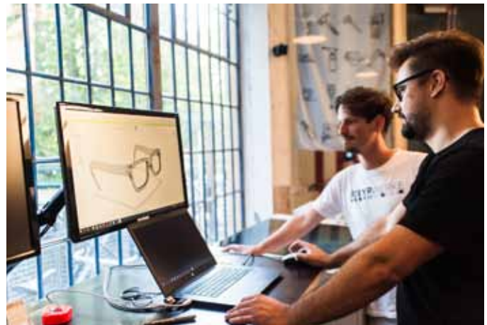
Design eines Brillen-Prototypen für den 3D-Druck im Makerspace

Für eine Projektdauer von drei Jahren wird auf einer Fläche von knapp 150 Quadratmetern in einem top ausgestatteten Techniklabor die weltweite Maker-Idee des innovativen Selbermachens gelebt. Das Angebot richtet sich in erster Linie an technisch interessierte Privatpersonen, die rund um die Uhr mit neuen, aber auch traditionellen Technologien an Hobby-Projekten oder auch Prototypen arbeiten möchten. Besucherinnen und Besucher des Museums können sich die Räumlichkeiten und die dort gelebte Form des kollaborativen Arbeitens im Kontext der neuen Ausstellung (Eröffnung: 3. Mai 2018) erschließen. Aktuell ist der Raum mit mehreren 3D-Druckern, einem Laser-Cutter, einem Vinyl-Cutter, einer Virtual-Reality-Brille, einer CNC-Fräse, einer gut ausgestatteten Holzwerkstatt, mehreren Elektronik-Arbeitsplätzen und einer Sand-