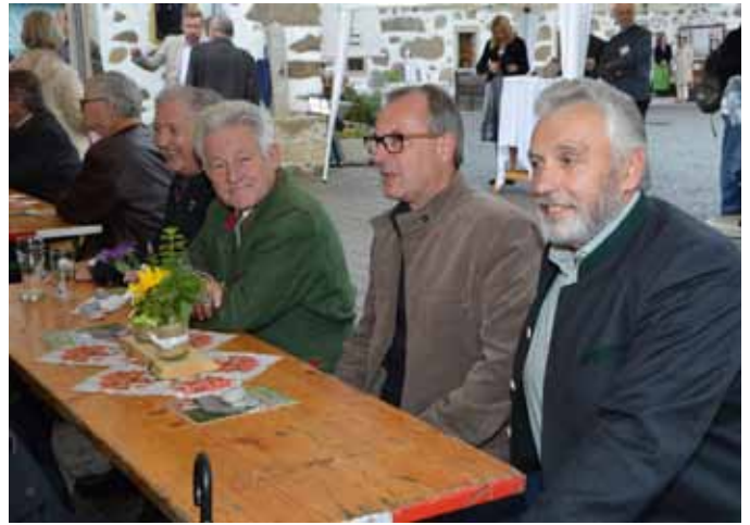
Ehregäste aus Politik, Kultur und Volkskultur kamen zur Jubiläumsfeier.

Bauernmöbelmuseum Hirschbach Museumsweg 7 | 4242 Hirschbach im Mühlkreis Tel.: +43 (0) 7948/541 E-Mail: museum@hirschbach.at Web: www.4242.at/museum Öffnungszeiten: Mai bis Oktober Dienstag bis Samstag 14:00 bis 17:00 Uhr Sonntag 10:00 bis 12:00 und 14:00 bis 17:00 Uhr 3. Dezember bis 6. Jänner Samstag, Sonntag, Feiertag von 14:00 bis 17:00 Uhr und nach Voranmeldung