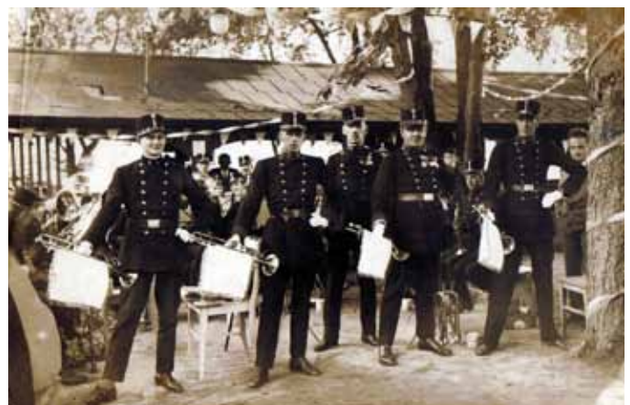
Konzert der Bürgerkorpsmusik im Gastgarten Jäger, 1930