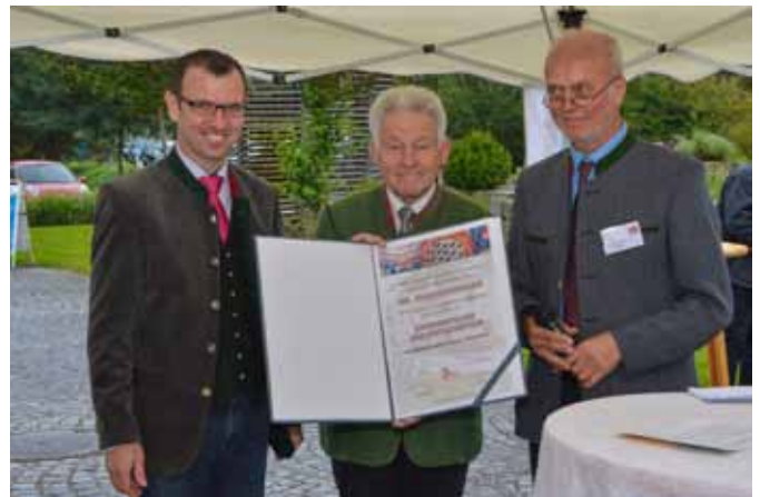
Landeshauptmann a. D. Dr. Josef Pühringer wurde zum Ehrenmitglied und Botschafter des Bauernmöbelmuseums Hirschbach ernannt.