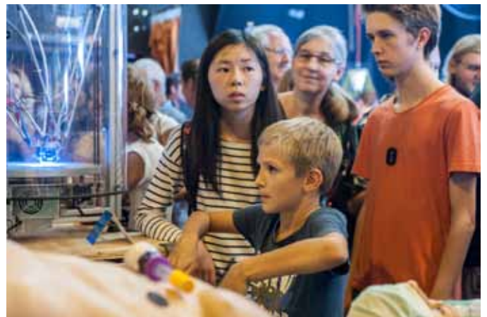
Neben zahlreichen Workshops hat es auch Mitmachstationen im Ausstellungsbereich gegeben.

Museum Arbeitswelt Wehrgrabengasse 7 | 4400 Steyr Tel.: +43 (0) 07252/77 351-0 E-Mail: office@museum-steyr.at Web: www.museum-steyr.at Öffnungszeiten: 4. April bis 17. Dezember 2017 Dienstag bis Sonntag 9:00 bis 17:00 Uhr Führungen nur gegen Voranmeldung