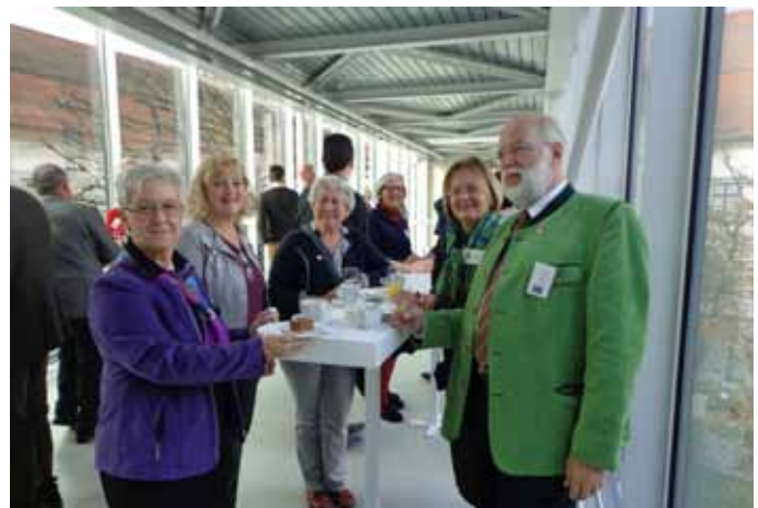
Die Pause wurde für anregende Gespräche und gegenseitigen Austausch genutzt