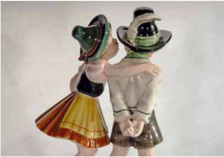
Keramos Wien, Geheimnis, ModNr. 2091/Rückansicht