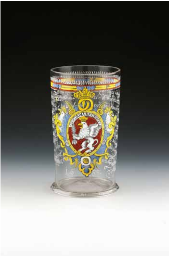
Zunftglas der Bäcker, Franken, 1685, Glas