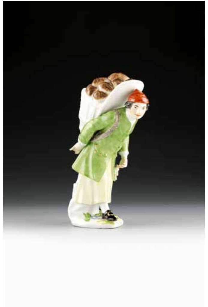
Brotverkäufer aus Meißener Porzellan, um 1745