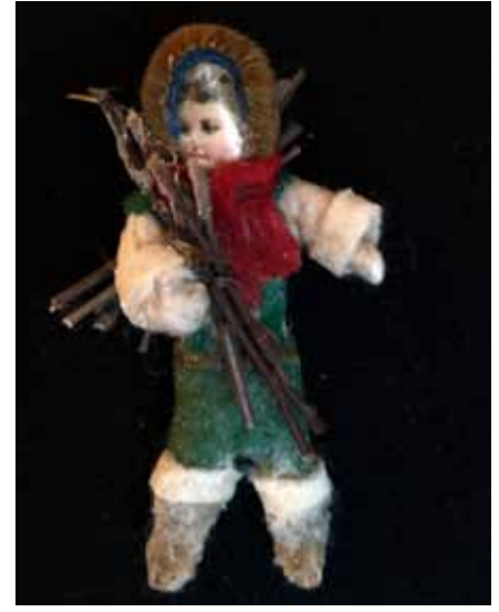
Objekte aus der Sammlung Kren-Kwauka