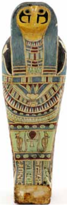
Kornmumie, Ägypten, 300 v. Chr.–50 n. Chr., Holz/Schlamm/Getreidekörner/Binden