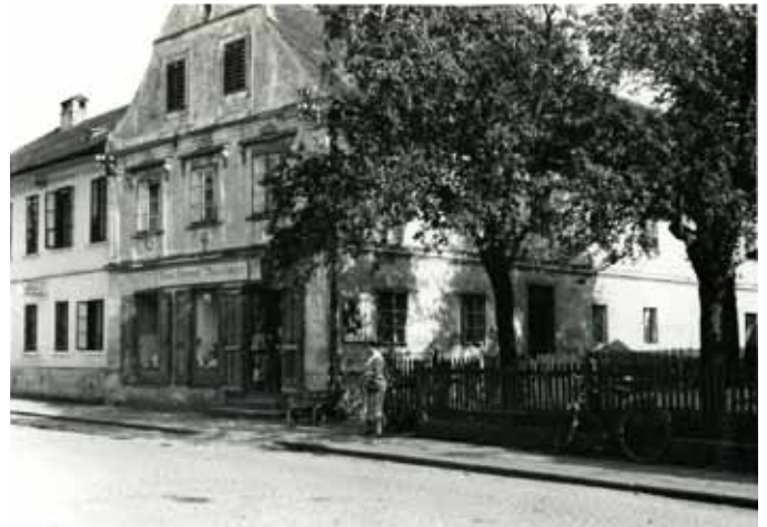
Im so genannten Dimmelhaus wurde die erste Ausstellung zur Perger Geschichte gezeigt, 1950