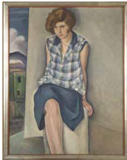
Sitzendes Mädchen, 1928, Öl auf Leinwand, 122 x 94 cm, Landesgalerie Linz, Sammlung Moderne und Zeitgenössische Kunst, Inv. Nr.: G 819

In Kooperation mit dem Oberösterreichischen Landesmuseum ist seitens des Verbundes Oberösterreichischer Museen für das kommende Jahr unter der Domain www.ooe2018.at ein eigener Veranstaltungskalender zur Übersicht über die Aktivitäten in den Museen Ober-