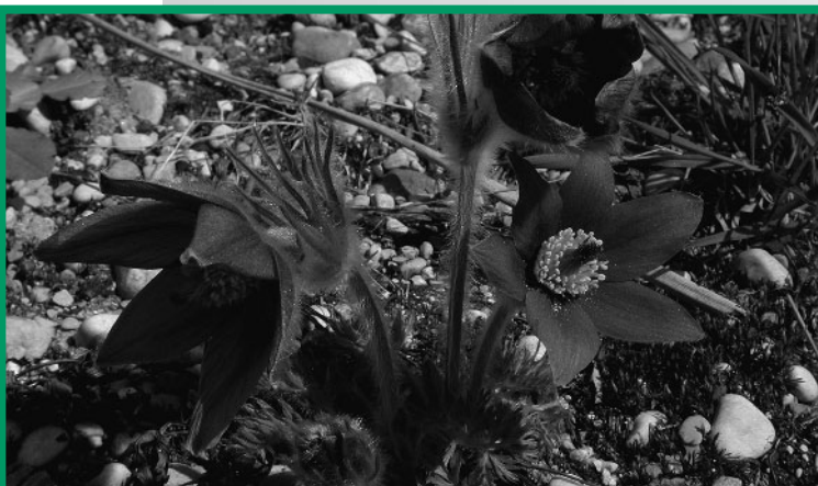
Lebendansammlungen übernehmen eine wichtige Aufgabe zum Schutz bedrohter Pflanzensippen. Die Abbildung zeigt eine Erhaltungskultur am Biologiezentrum einer in Oberösterreich bedrohten Population der Küchenschelle ( Pulsatilla vulgaris ).

In den letzten Jahrzehnten wurden vermehrt Initiativen gegründet, die den Schutz bedrohter Pflanzensippen zum Ziel haben. Projekte wie das European Native Seed Conservation Network (ENSCONET) oder die Convention on Biological Diversity (CBD) behandeln vielfältige Aspekte biologischer Diversität wie genetische Ressourcen, Arten und Ökosysteme. In allen diesen Initiativen nimmt die Sicherung des genetischen Materials von (bedrohten) Pflanzensippen in der Form von so genannten ex-situ Lebendansammlungen einen wichtigen Stellenwert ein. Solche Lebendansammlungen dienen nicht nur der Naturschutzforschung, um etwa geeignete Management-Maßnahmen für bestehende Populationen im Ursprungshabitat zu erarbeiten oder aber die Populationsstruktur zu erfassen, sondern können auch Ausgangsmaterial für Wiederansiedlungsprojekte an geeigneten Ersatzstandorten zur Verfügung stellen.