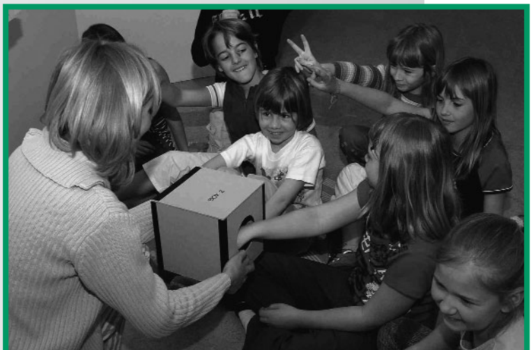
Tastspiele lockern die Führungen in den Sonderausstellungen auf.