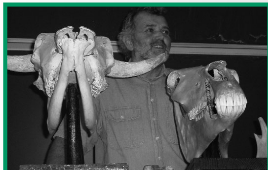
Schädel, Knochen und Präparate tragen zu einer lebendigeren Unterrichtsgestaltung und zu einem besseren Verständnis der lebendigen Natur bei.

Die naturkundliche Schulsammlung an unserer Schule hat eine über hundertjährige Geschichte. Eine Fülle von Präparaten und Schaustücken hat sich über die Jahre „angesammelt“, zusammengetragen von leidenschaftlichen Sammlern – Professoren am Petrinum –, gespendet von Missionaren und Klöstern. Die Bandbreite reicht von Stopf- und Flüssigpräparaten, von Knochen, Skeletten und Schalen, von einer umfangreichen Käfer- und Schmetterlingsammlung über Herbarien und Pflanzenpräparate bis hin zu einer Fülle an Mi-