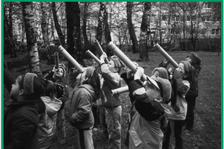
Kinder mit Fernrohren im Ökopark: Vorschulkinder auf Entdeckungsreise im Ökopark.

Seit 2002 werden neben den Sonderausstellungen auch im Ökopark Vermittlungsprogramme für Vorschulkinder, Schüler/innen und Familien angeboten. Die Entdeckung der Natur mit allen Sinnen steht dabei an oberster Stelle. Dafür gilt es die Augen und Ohren der Besucher/innen zu schärfen und sie für die Tiere im Ökopark zu sensibilisieren. Unterstützend wirken in diesem Zusammenhang Spiele, die noch vor der Entdeckungsreise durch die heimische Flora und Fauna durchgeführt werden. Im Ökopark wer-