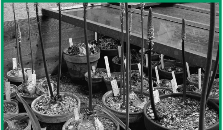
Botanische Lebendansammlungen ermöglichen die vergleichende Untersuchung von Merkmalen, die an getrocknetem Herbarmaterial schwierig oder gar nicht erfasst werden können.

gungen angelegt. Solche Lebendansammlungen sind von immensem wissenschaftlichem Wert, da bestimmte Untersuchungen nur an Lebendmaterial durchgeführt werden können. Dazu gehören etwa karyologische Untersuchungen wie Chromosomenzahl und -morphologie oder die Erfassung von Tier-Pflanze-Interaktionen