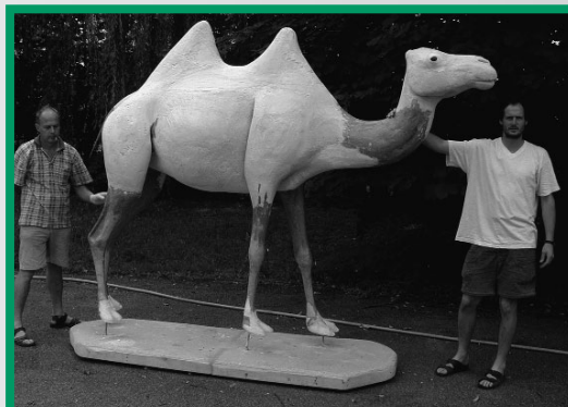
Vorbereitung für ein naturnahes Kamelpräparat.

Die Aufbewahrung biologischer Objekte in Weingeist – „Spiritus vini“ – lässt sich in Europa bis ins 12. Jahrhundert zurückverfolgen. Formaldehyd eignet sich nicht für Proben, die einer DNA-Untersuchung zugeführt werden sollen, und wird nicht zuletzt wegen seiner Giftigkeit immer weniger verwendet. Gewebeproben für genetische Untersuchungen werden wie andere Flüssigpräparate in 70%igem Alkohol aufbewahrt.