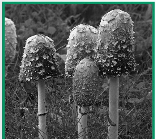
Giftig oder nicht? Die Mykologische ARGE kennt die Antwort und informiert. Im Bild der essbare Schopftintling ( Coprinus comatus ).

Weitere Informationen: www.biologiezentrum.at