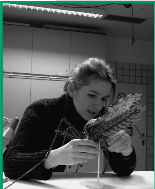
Tierpräparation und Modellage im Museum.

Durch die langjährigen Erfahrungen in Bezug auf Ausstellungen sind die besten Voraussetzungen für eine publikumsattraktive Präsentation der Natur Oberösterreichs im Linzer Schlossmuseum gegeben – eine Herausforderung, die das Team des Biologiezentrums mit Begeisterung und Elan angenommen hat.