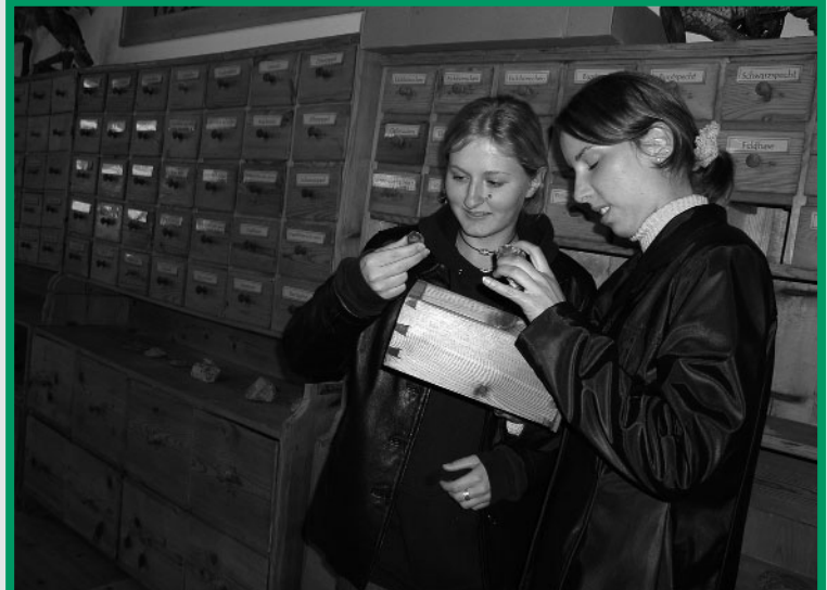
Waldhaus Windhaag – Waldapotheke: Die Waldapotheke des Waldhauses in Windhaag bei Freistadt lädt zum Entdecken ein.

Einem ganz anderen Thema wendet sich das Dachsteinhöhlenmuseum in Obertraun zu. Dieses Museum ragt nicht nur durch seine besondere Thematik, sondern auch durch seine Lage aus der oberösterreichischen Museumslandschaft heraus. Es liegt nämlich in 1.350 m Seehöhe bei der Mittelstation der Dachsteinbahn. Inhaltlich liegt der Schwerpunkt auf der Erforschung der Dachsteinhöhlen. Als besondere Attraktion kann das Museum auch mit einem Modell der insgesamt 48 km erforschten Gänge der Mammuthöhle aufwarten. In Vitrinen sind Tropfsteine, Funde von Höhlentieren und Mineralien aus den Höhlen ausgestellt.