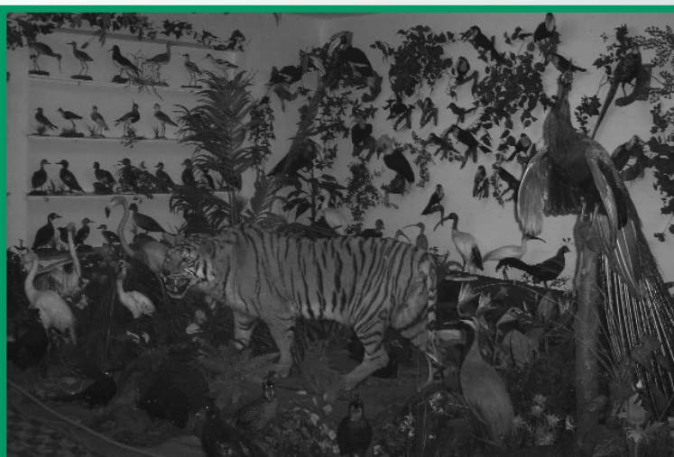
Salzkammergut Tierweltmuseum: Das Salzkammergut Tierweltmuseum in Pinsdorf widmet sich der heimischen und exotischen Tierwelt.

In Krenglbach bei Wels findet sich der Zoo Schmiding. Hinter dem Namen Zoo Schmiding verbirgt sich nicht nur ein Zoo im klassischen Sinn, sondern viele weitere faszinierende Projekte, wie das Museum der Begegnung der Kulturen, das sich auf 2.000m 2 Ausstellungsfläche den letzten Naturvölkern widmet und mit dem Österreichischen Museumspreis ausgezeichnet wurde. Zahlreiche botanische Anlagen machen den Zoo Schmiding zu einem bemerkenswerten Zentrum für Natur und Kultur.