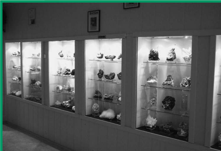
Mineralienmuseum Mining – Blick in die Sammlung des Mineralienmuseums in Mining.

Ein kurzer Streifzug durch die Museumslandschaft soll das naturkundliche Angebot in Oberösterreichs Museen veranschaulichen.