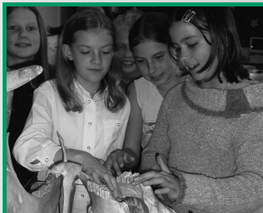
Naturkundliche Schaustücke bilden eine anregende und somit wertvolle Ergänzung zu modernen Unterrichtsmitteln.

Natürlich stellt sich dennoch immer wieder die Frage, ob in der heutigen Zeit die Erhaltung einer solch umfangreichen Sammlung für die Schule noch ihre Berechtigung hat. Räumliche Ressourcen werden belegt (im Petrinum stehen zwei große Räume für die Sammlung zur Verfügung), die eventuell anders sinnvoller verwendet werden könnten. Der zeitliche und finanzielle Aufwand, um die Sammlung „topp“ zu halten, ist nicht mehr aufzubringen. Wir sind daher genötigt, einen Mittelweg zu finden, die zur Verfügung stehenden finanziellen Mittel so aufzuteilen, um einerseits einen möglichst großen Teil der Sammlung zu erhalten, andererseits natürlich auch neue Unterrichtsmittel anzuschaffen. Das Ziel ist, aus dem reichen Fundus eine Art Mustersammlung (durch Renovierung der Präparate und ergänzende Neuanschaffungen) zusammenzustellen, die gezielt im Unterricht eingesetzt werden kann. Der Rest scheint leider dem Verfall preisgegeben zu sein (z.B. die Insektensammlung).