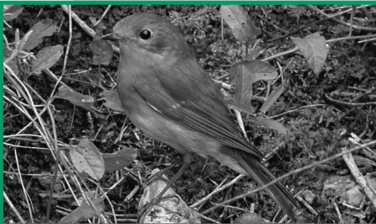
Das Rotkehlchen ( Erithacus rubecula ), eine der ca. 393 Vogelarten in Oberösterreich im Blickwinkel der Arbeitsgemeinschaft.

Eine der wesentlichen Stützen naturkundlicher Forschung in Oberösterreich sind die biologischen Arbeitsgemeinschaften (ARGE) am Landesmuseum, derzeit die Entomologische [Insektenkundliche] ARGE (seit 1921), die Botanische ARGE (seit 1931), die Ornithologische [Vogelkundliche] ARGE (seit 1950), die Mykologische [Pilzkundliche] ARGE (seit 1964) und die Geowissenschaftliche [Erd-