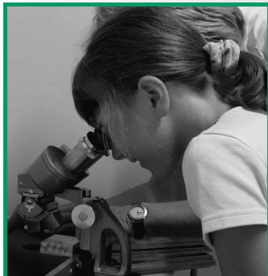
Junge Forscherin im Biologiezentrum.

Die erarbeiteten Konzepte (Führungen, Workshops, Aktivblätter bzw. Öko-Rucksack) orientieren sich an den Bedürfnissen der Besucher/innen. Je nach Alter und Interesse werden die Programme durch Spiele und Anschauungsmaterialien zum Begreifen aufgelockert. Das selbständige Entdecken und Forschen als Methode ist dabei besonders wichtig: Warum kann ein Wasserläufer auf dem Wasser laufen? Diese Frage beantworten Kinder zum Beispiel, indem ein kleiner Versuch zur Oberflächenspannung von Wasser gemacht wird – Learning by doing!