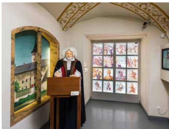
Dorothea Jörger. Auf dem Pult "Brief Martin Luthers an Dorothea Jörger, 1528", Reproduktion

2017 begehen wir das 500-jährige Jubiläum der Reformationsbewegung, die – ausgelöst durch Martin Luthers Thesenanschlag in Wittenberg – einen Glaubenskampf in ganz Europa entfachte. Nahezu 80 Prozent der oberösterreichischen Bevölkerung bekannten sich auch zum evangelischen Glauben, bis es im Zuge der Gegenreformation zu dessen fast vollständiger Niederschlagung beziehungsweise Verdrängung kam. Heute nimmt die evangelische Glaubensgemeinschaft mit 3,4 Prozent der österreichischen Gesamtbevölkerung (Stand Ende 2016) einen