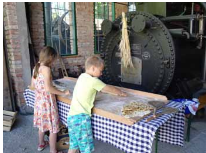
Zelten backen in der Furthmühle Pram