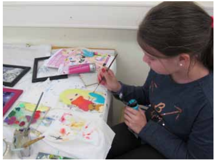
Hinterglasmalen mit Kindern