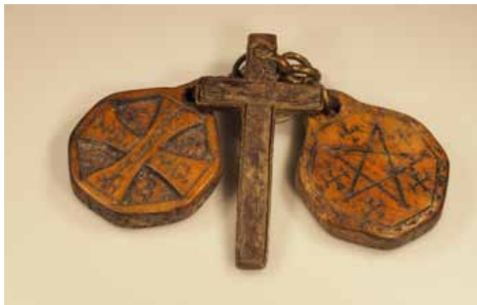
Kreuz und Schutzamulette mit Benediktussegens und rückseitiger Sator-Formel gegen Hexen und Teufel