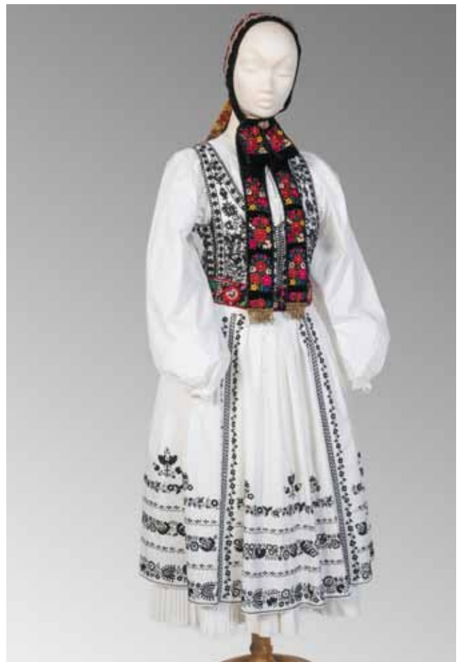
Puppe in Siebenbürgertracht