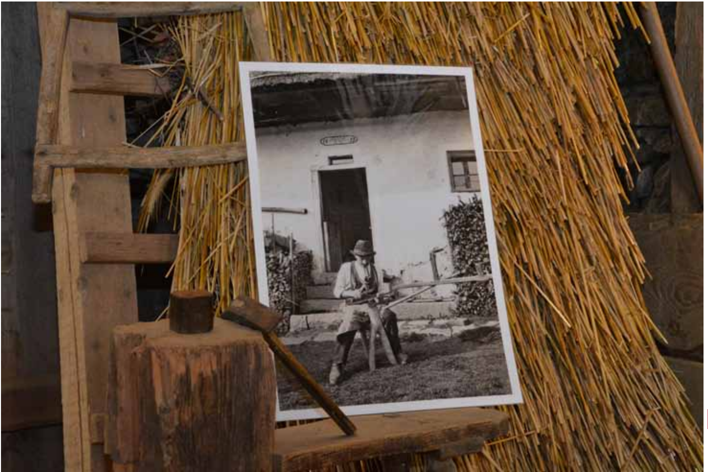
Am 20. Mai wird im Freilichtmuseum Pelmberg die Fotoausstellung „Bauernarbeit in früherer Zeit“ eröffnet.

fungsmöglichkeiten, so dass jedes Museum mit seiner spezifischen und facettenreichen Sammlung an diesem besonderen Tag teilnehmen kann. Der Phantasie und dem Ideenreichtum der Museumsmitarbeiterinnen und -mitarbeiter sind hier keine Grenzen gesetzt!