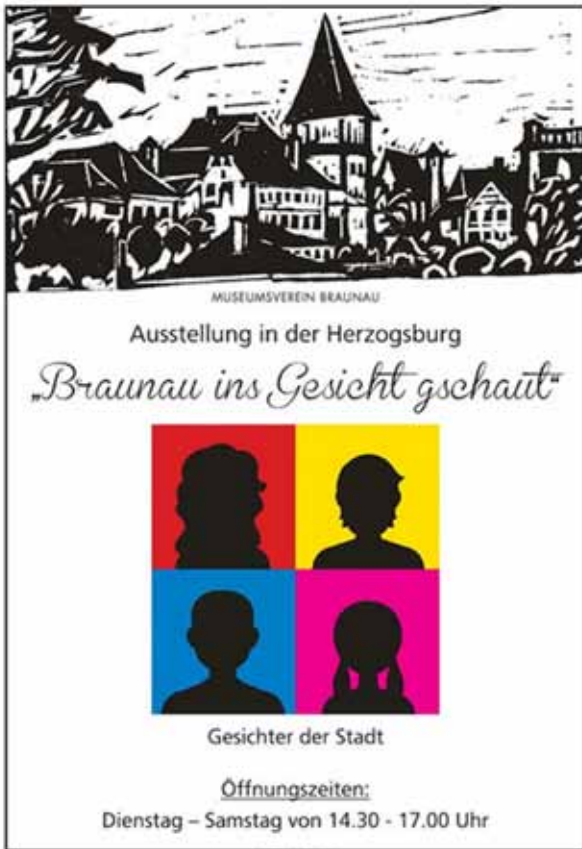
Ausstellungsplakat (Bezirksmuseum Herzogsburg)