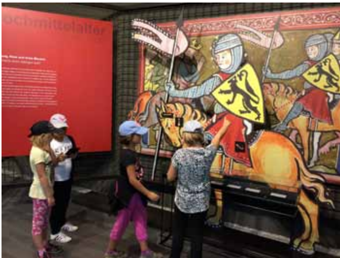
OÖ. Burgenmuseum Reichenstein