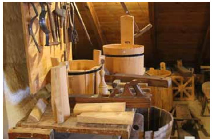
Handwerkerhaus Stegwagner

Nun ist 2016 in Windhaag bei Freistadt ein vergleichbarer Fall aufgetreten. Ein kleines Gebäude aus dem 17. Jahrhundert, in dem das Handwerkerhaus bisher untergebracht war, soll in absehbarer Zeit verkauft werden. Das Museum muss daher ausziehen, der Trägerverein hat aber nur begrenzte Möglichkeiten, die Sammlung an anderen Orten unterzubringen. Das Museum wird aufgelöst und die Sammlung muss zumindest stark reduziert werden. Die Abgabe von Museumsobjekten und erst recht die Auflösung einer musealen Einrichtung kann aber nicht einfach von heute auf morgen erfolgen und muss vor allen Dingen nach ethisch vertretbaren