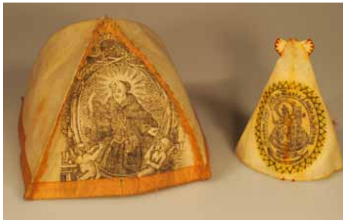
Fraisenhemd und- häubchen

Samstag, Sonn- und Feiertag 11:00 bis 17:00 Uhr