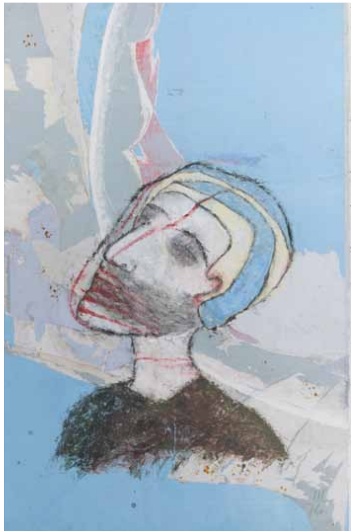
Köpfe II von Gerhard Reitinger, Österreichisches Papiermachermuseum

Redaktionelle Bearbeitung: Elisabeth Kreuzwieser