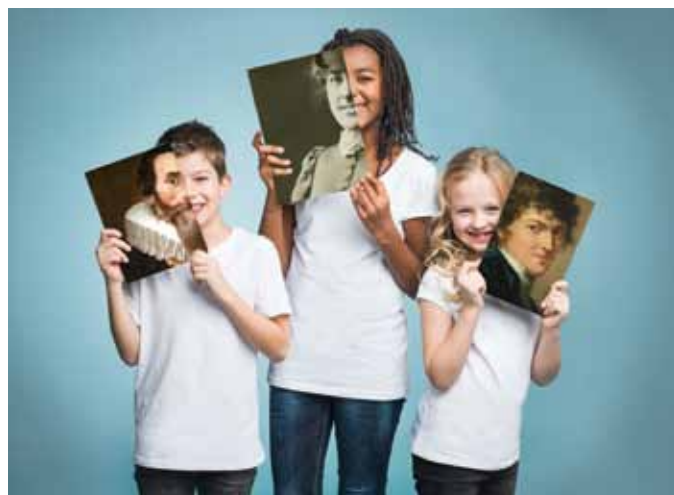
Wir sind Oberösterreich! Entdecken. Staunen. Mitmachen.

Die Ausstellung Wir sind Oberösterreich! wird in großen Teilen aus den umfangreichen Beständen des Museums bespielt. Von Schmetterlingen aus den naturhistorischen Sammlungen über „schräge“ Zeichnungen von