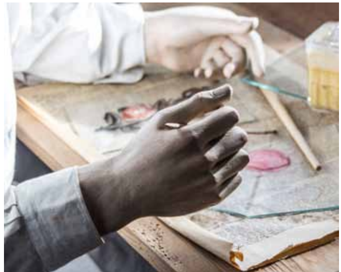
Hinterglasmuseum Sandl