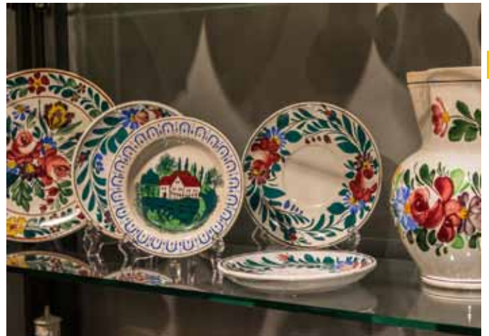
Steingut im Museum Pregarten