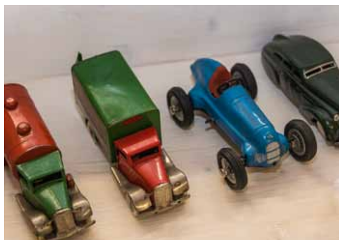
Solche Spielzeuge begeistern jedes Kind

Das Museum Pregarten bietet weiters die umfassende Schau der Produkte der 1. OÖ Steingutfabrik, die vor rund 100 Jahren am Areal des heutigen Kulturhauses Bruckmühle angesiedelt war. Die Lage war optimal – direkt an der Eisenbahnlinie Linz–Budweis gelegen, Kaolin aus Kriechbaum, Kohle aus Böhmen, Sand und Ton in der unmittelbaren Umgebung. Produziert wurden Haushaltswaren, Spitalsgeschirr und technische Keramik. Zahlreiche Produkte, Malervorlagen, Arbeitsbücher, Dienstzeugnisse, Baupläne et cetera runden diese Ausstellung ab. Scherben zum Angreifen in den unterschiedlichsten Fertigungsstufen lassen alle Sinne mitleben.