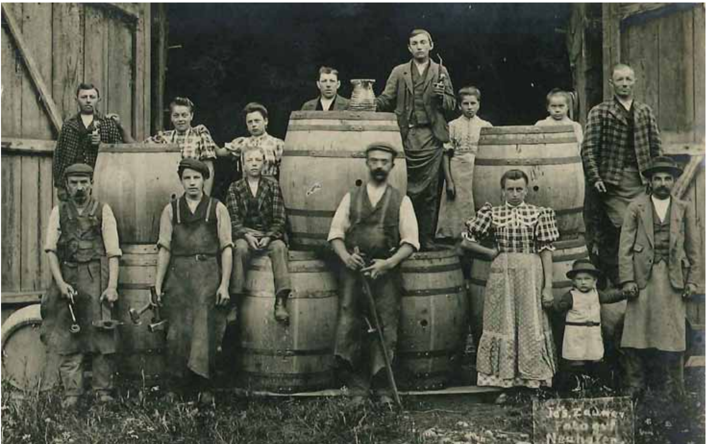
Bauernfamilie aus Neuhofen, um 1920