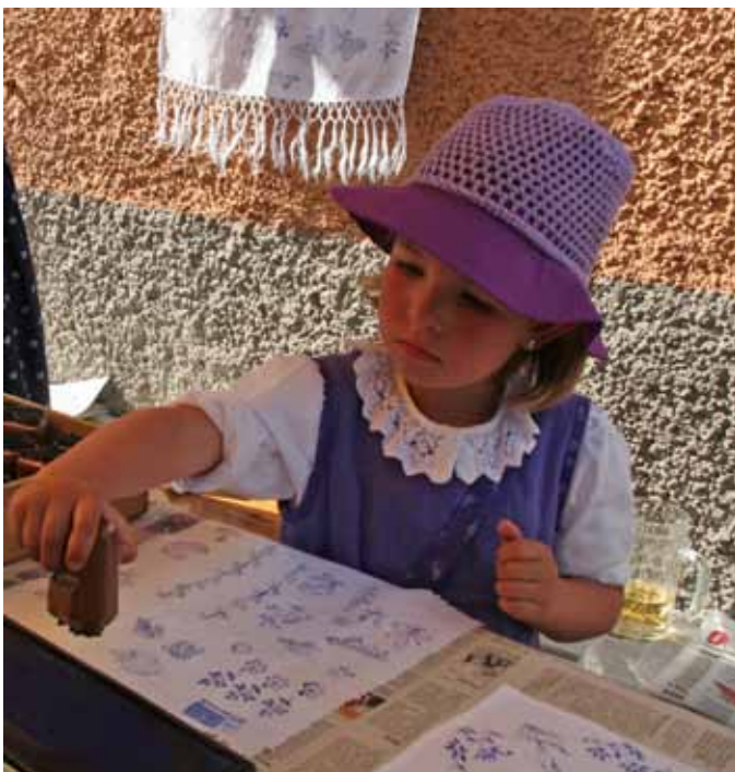
Stempeln mit Blaudruckmodellen