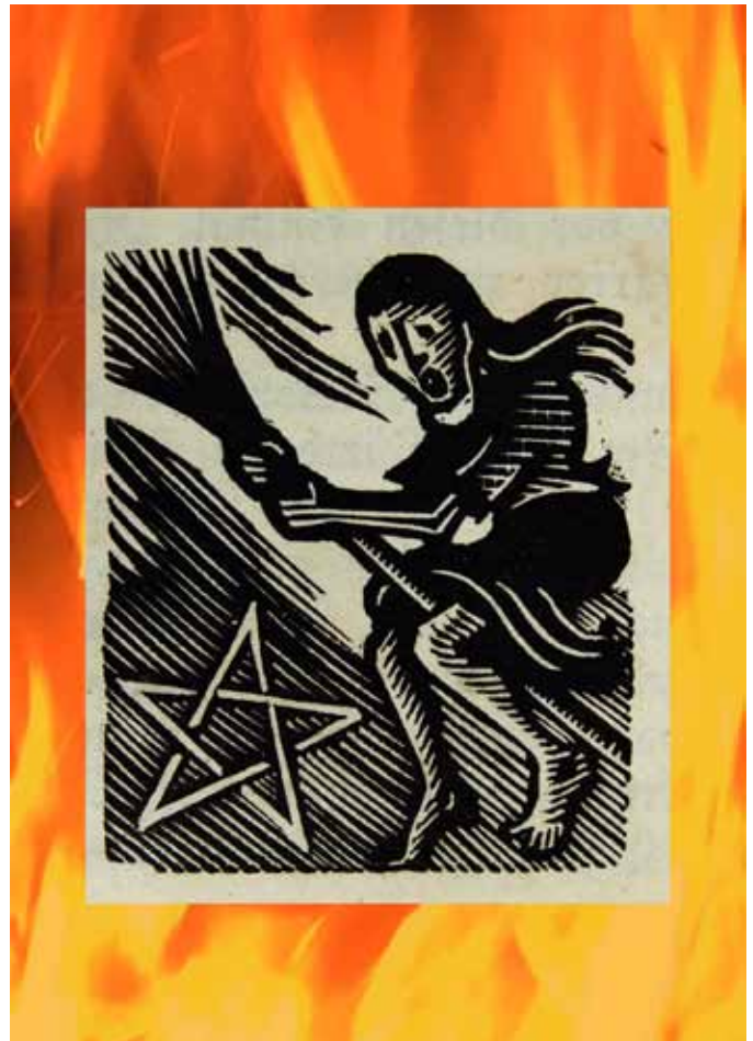
Sujet des Einladungsfolders