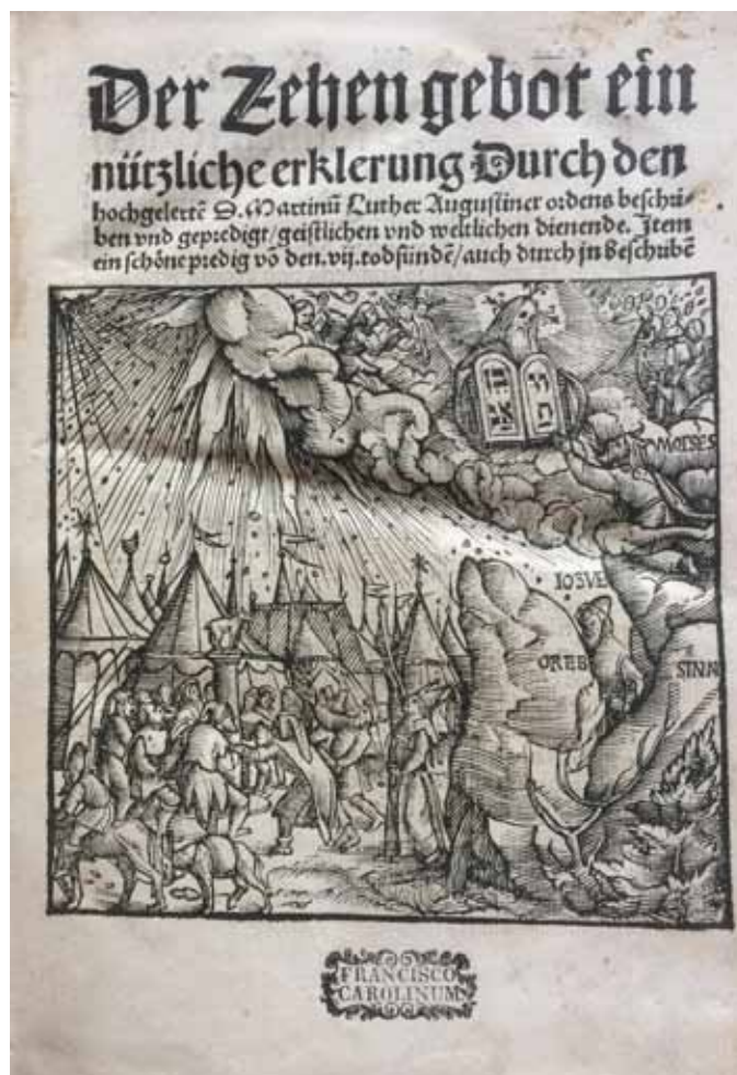
Luther, Martin/Münster, Sebastian: Der Zehen gebot ein nützliche erklerung Durch den hochgelerten D. Martinum Luther Augustiner ordens beschriben und gepredigt, geistlichen und weltlichen dienende. Item ein schöne predig von den vij. todsünden, auch durch jn beschriben. – Basel: durch den fürsichtigen Adam Petri 1520, Signatur I-419

Mit Blick auf längerfristige Ausstellungsplanungen wollen wir zum Jubiläumsjahr 2018 einen Schwerpunkt auf „100 Jahre Republik Österreich“ und „100 Jahre Oberösterreich“ legen. Der schon seit dem 17. Jahrhundert inoffiziell geführte Name „Oberösterreich“ wurde nach dem Zusammenbruch der österreichisch-ungarischen Monarchie für das Erzherzogtum Österreich ob der Enns offiziell als Bezeichnung des Bundeslandes eingeführt. Was aber bedeutete dieser formale Akt für die Identität der österreichischen Bevölkerung? Wie ging man um