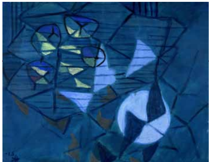
Breustedt Hans Joachim, Früchte bei Mond, 1951, Inv. Nr.: Ha III 11572; Tempera, Material: Papier