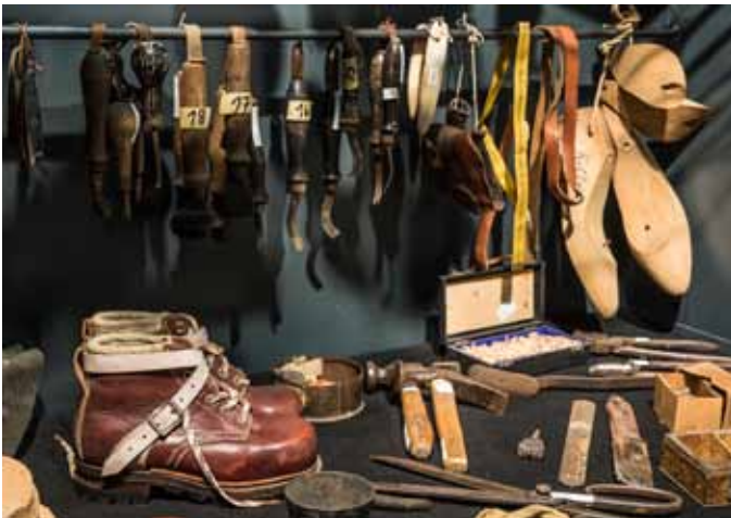
Der Schuster und sein Werkzeug