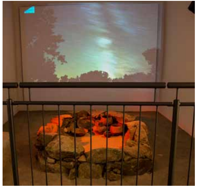
Stimmungsvolle Präsentation eines Hügelgrabes im ehemaligen Eiskeller