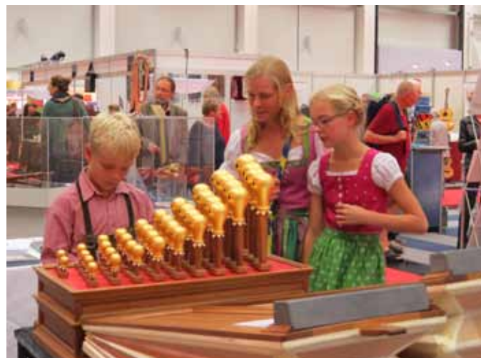
Apfelregal auf der Musikmesse Ried