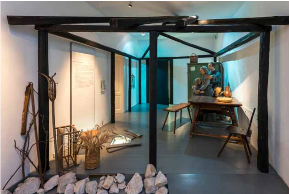
Raum "Geheimplösterantismus" im Evangelischen Museum Oberösterreich

Reformation beziehungsweise der Gegenreformation stehen. Die Leihgaben stammen aus dem Augustiner Chorherrenstift St. Florian, dem Benediktinerstift Kremsmünster, dem Benediktinerstift Lambach und dem Prämonstratenser Chorherrenstift Schlägl. museum-ooe.evangel.at