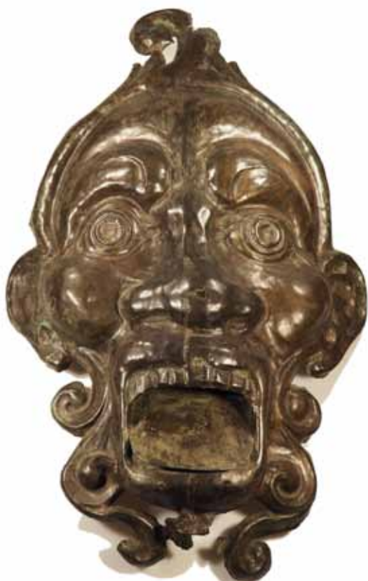
Kleinkotzer, getriebenes Kupferblech