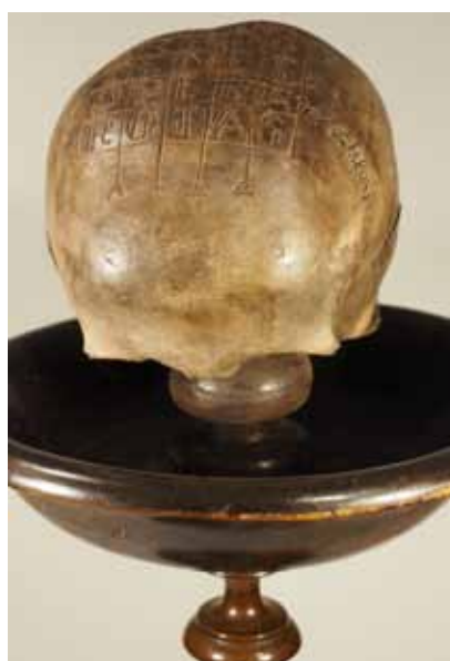
Schwurschädel mit SATOR-Formel