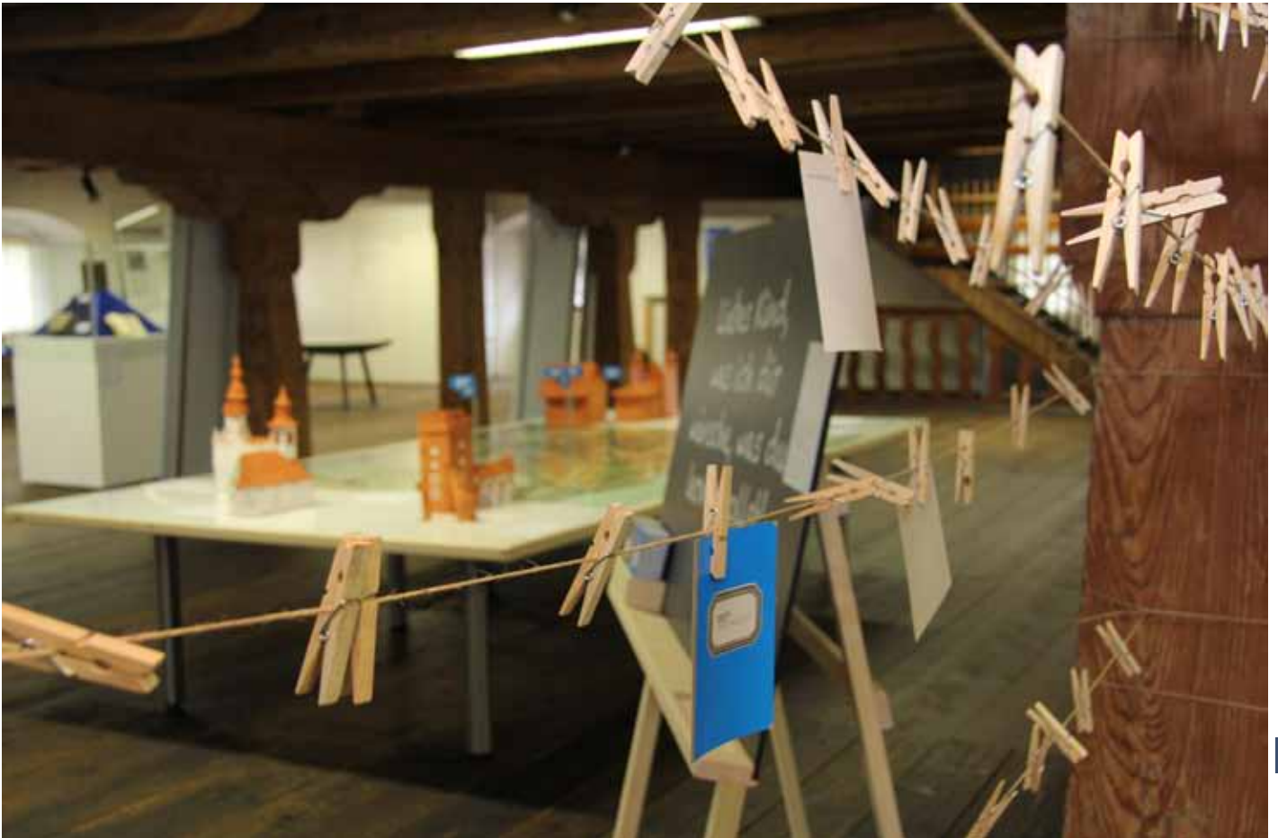
Interaktive Elemente der Ausstellung 1817! UND HEUTE? in Steyr