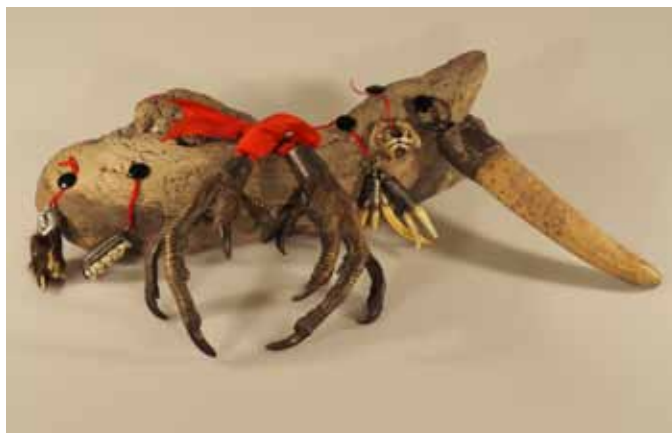
Verschiedene tierische Amulette